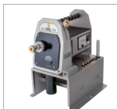
Tronquateur module simple pour Ultima-TIG et Ultima-TIG-Cut.