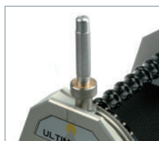
Il est possible de réaliser un plat à 90° avec une précision de 0.1 mm.