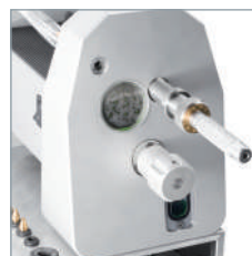
Coupez l'électrode en tournant la poignée