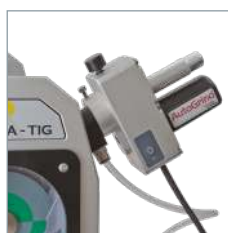
Module d'affûtage - rotation automatique du porte-électrode