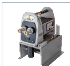
Tronquateur module double pour Ultima-TIG et Ultima-TIG-Cut.