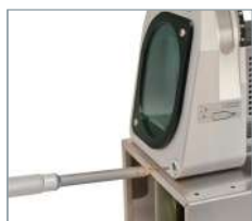
Positionnement précis de la pointe.