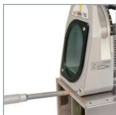
Positionnement précis de la pointe.