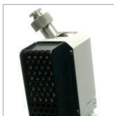
Filtre avec collecteur de poussière intégré, facile à remplacer.