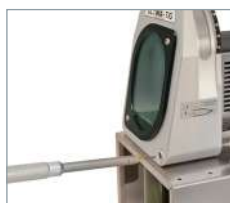
Positionnement précis du porte-électrode.