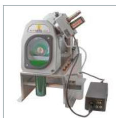
Adapté à l'Ultima-TIG-Cut