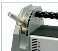
Angles d'affûtage de 7,5° à 90° pour des angles de pointe précis de 15° à 180°.