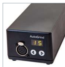
Boîtier de contrôle - écran digital pour l'ajustement du temps d'affûtage