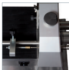
Déterminez la longueur de la coupe de l'électrode