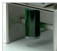
Réceptacle hermétique pour la collecte et le recyclage de la poussière.