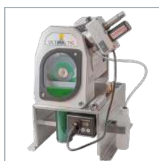
Adapté à l'Ultima-TIG