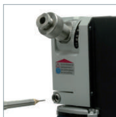
Réglage précis de la longueur de l'électrode.