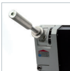
Affûtage avec angle précis de 15° à 180°.