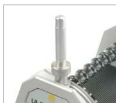
Il est possible de réaliser un plat à 90° avec une précision de 0,1 mm.