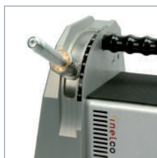
Affûtage de l'électrode avec l'angle désiré.