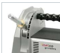
Angles d'affûtage de 7,5° à 90° pour des angles de pointe précis de 15° à 180°.